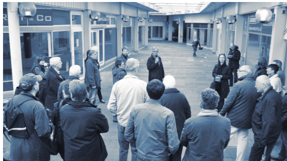
Begehung des City Center Peine