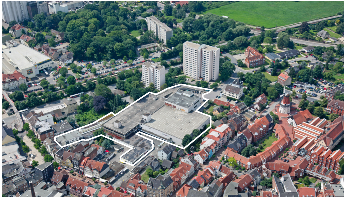
City Center Peine [Leerstand]

Forschungsfeld »Innovationen für Innenstädte« des Experimentellen Wohnungs- und Städtebaus