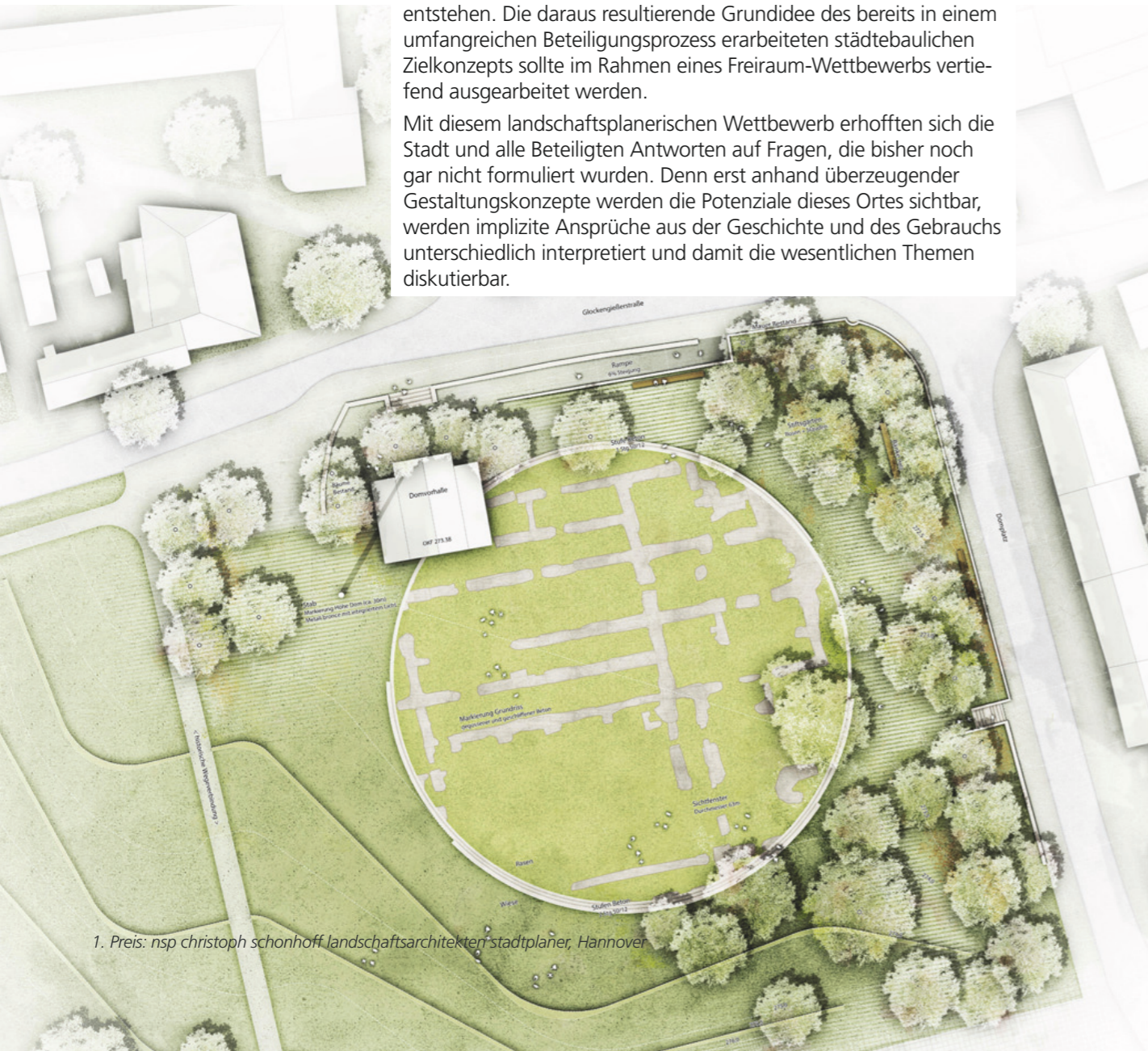
1. Preis: nsp christoph schonhoff, landschaftsarchitekten stadtplaner, Hannover

Mit diesem landschaftsplanerischen Wettbewerb erhofften sich die Stadt und alle Beteiligten Antworten auf Fragen, die bisher noch gar nicht formuliert wurden. Denn erst anhand überzeugender Gestaltungskonzepte werden die Potenziale dieses Ortes sichtbar, werden implizite Ansprüche aus der Geschichte und des Gebrauchs unterschiedlich interpretiert und damit die wesentlichen Themen diskutierbar.