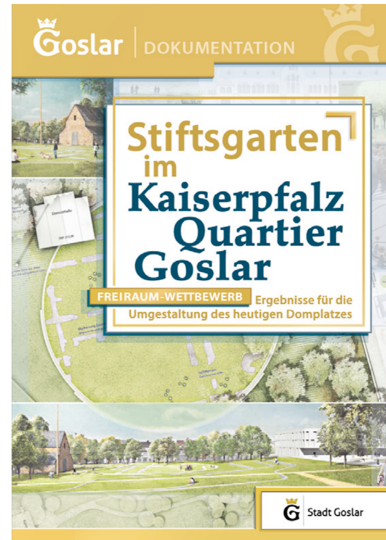
Dokumentation der Wettbewerbsergebnisse in einer Broschüre

Goslar Mittelzentrum | Niedersachsen Bevölkerung: 49.714 | Stand 2023