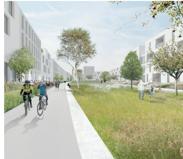
Stadtanger, Blick in Richtung Innenstadt

Braunschweig Oberzentrum | Niedersachsen 248.400 Einwohner | Stand 2013