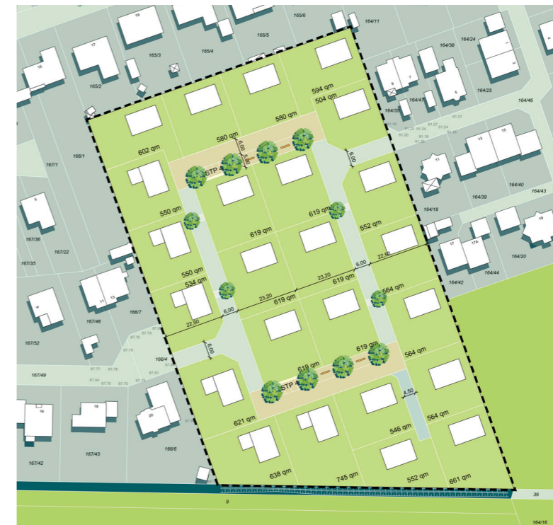
Vertiefung städtebauliches Konzept