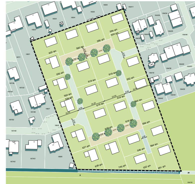
Vertiefung städtebauliches Konzept