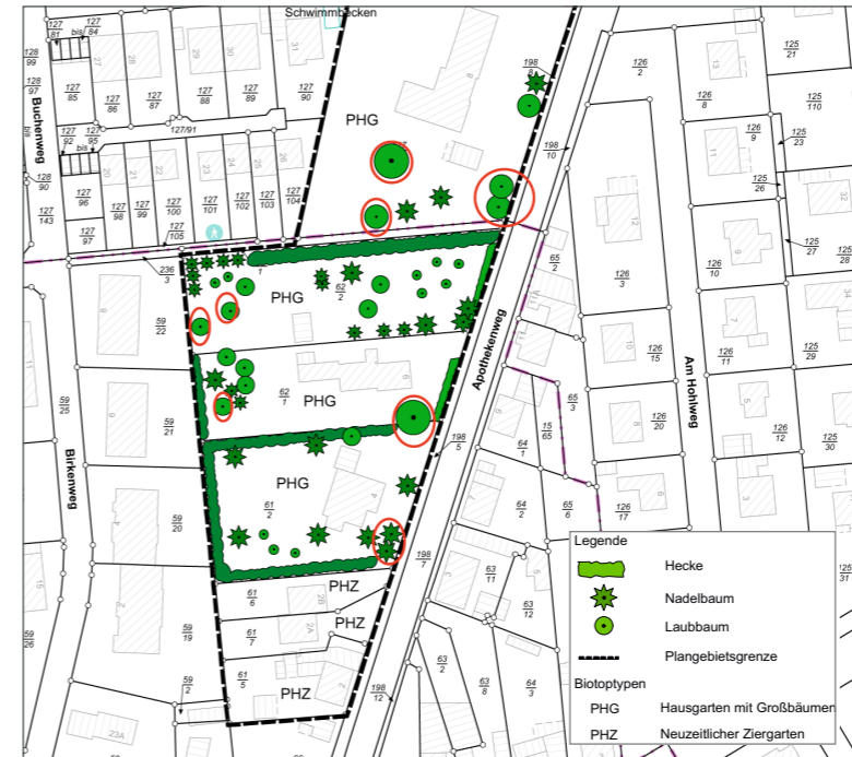
Kartierung Biotypen, Ausschnitt