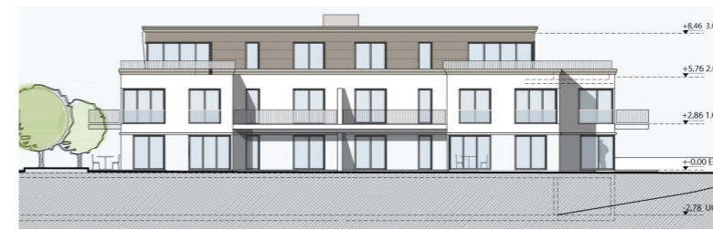
Ansicht Nord, Haus 1