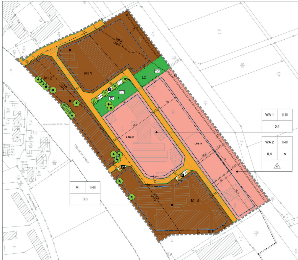
Planzeichnung zum Bebauungsplan

Mittelzentrum I Niedersachsen 49.680 Einwohner | Stand 2016