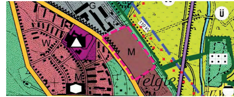
Planzeichnung zur FNP-Änderung