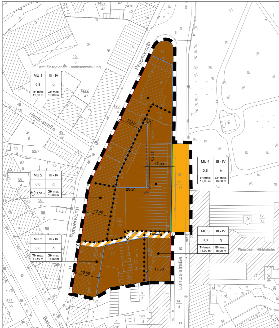
Planzeichnung zum Bebauungsplan