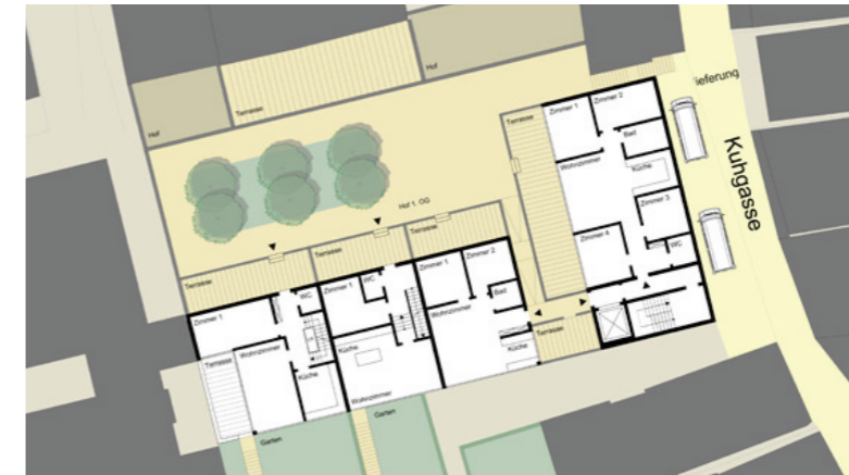
Beispielhafter Wohngrundriss, 1. Obergeschoss