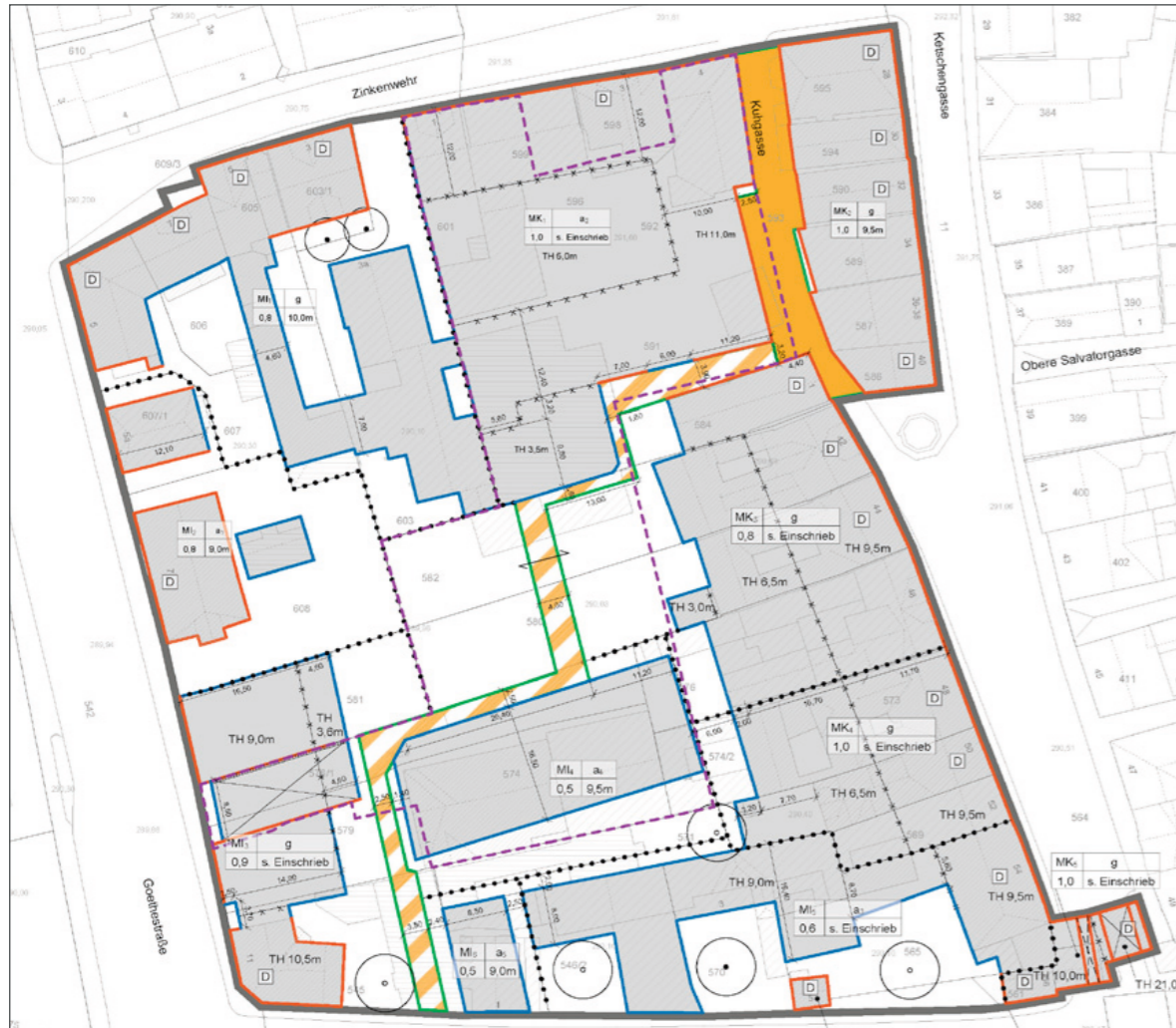
Planzeichnung zum Bebauungsplan

Coburg Oberzentrum | Bayern Bevölkerung: 40.842 | Stand 2022