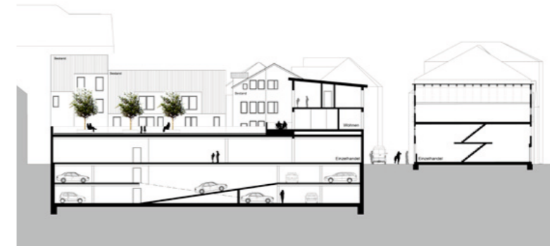
Schnitt durch die Quartiersgarage