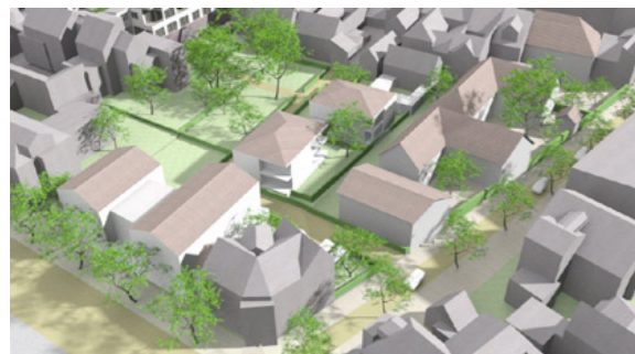
Blick von Südwesten, Variante Stadt villen und Höfe