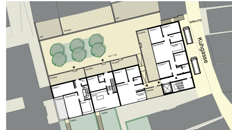
Beispielhafter Wohngrundriss, 1. Obergeschoss