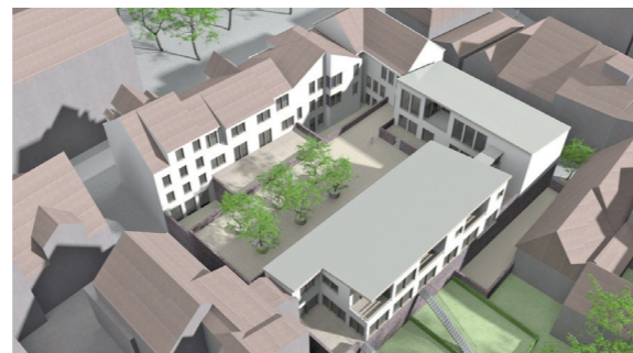
Blick von Südwesten in den Wohnhof im 1. Obergeschoss