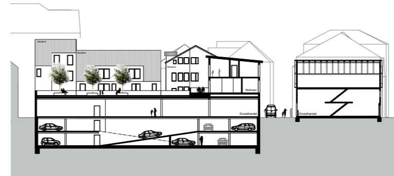
Schnitt durch die Quartiersgarage