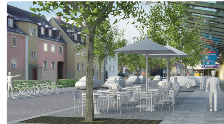
Visualisierung Westliche Poststraße