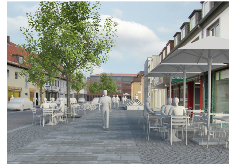
Visualisierung Östliche Poststraße