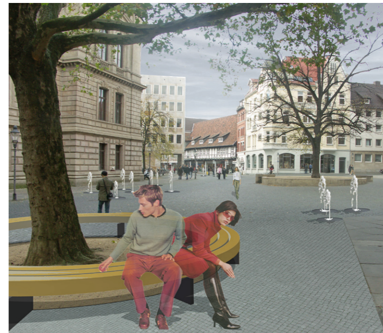
Perspektive mit Blick auf den Domplatz