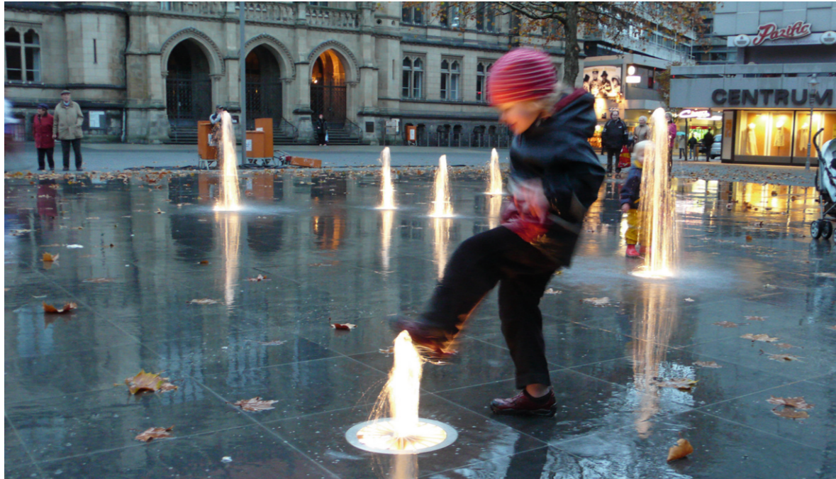
Platz der Deutschen Einheit mit Blick in Richtung Rathaus

Braunschweig Oberzentrum | Niedersachsen Bevölkerung: 253.167 | Stand 2022