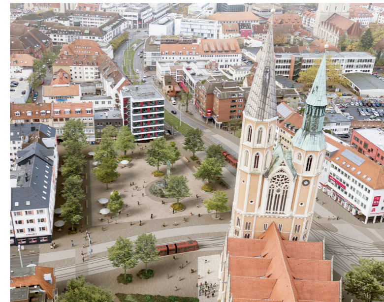
Vogelperspektive mit Blick in Richtung Marktplatz