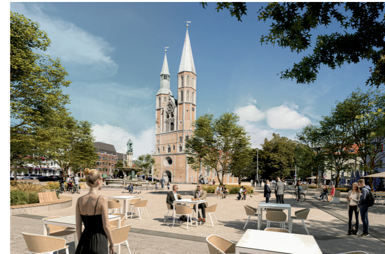
Blick in Richtung Katharinenkirche

Braunschweig Oberzentrum | Niedersachsen 248.300 Einwohner | Stand 2019