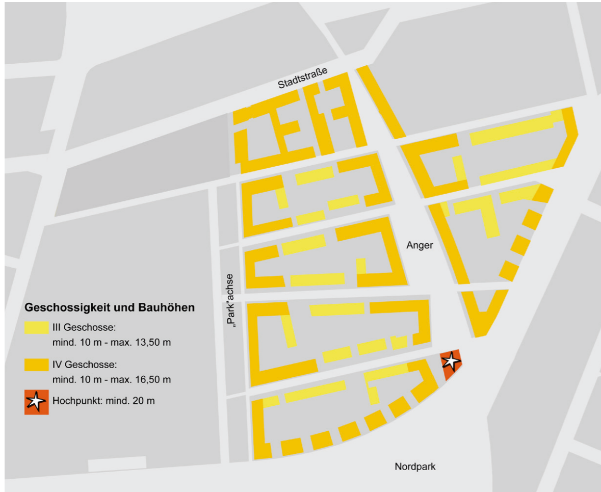
Verteilung der Geschossigkeit und der Bauhöhen im Baugebiet