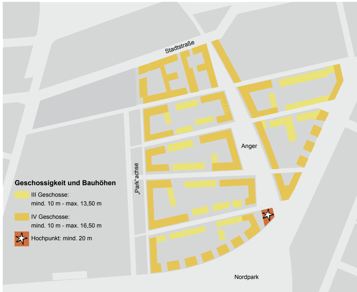
Verteilung der Geschossigkeit und der Bauhöhen im Baugebiet