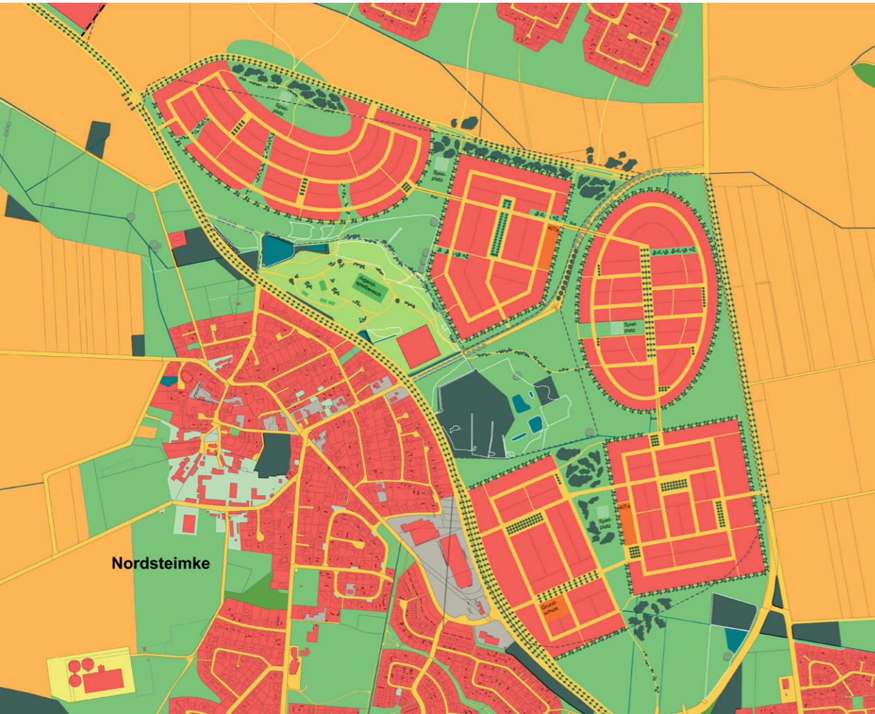
Vertiefung zum städtebaulichen Zielkonzept: Modell D – Prägnant und vernetzt