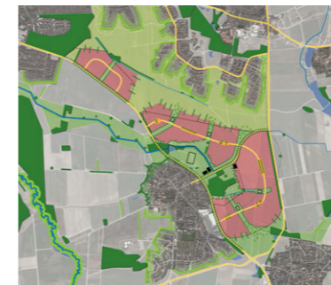
Modell A – Städtisch integriert