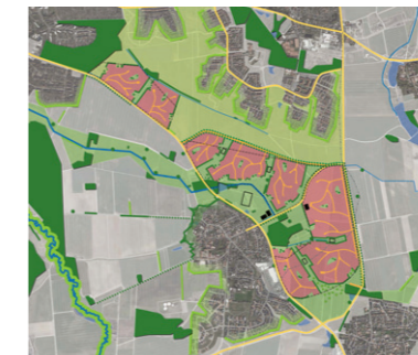
B – Organisch und privat