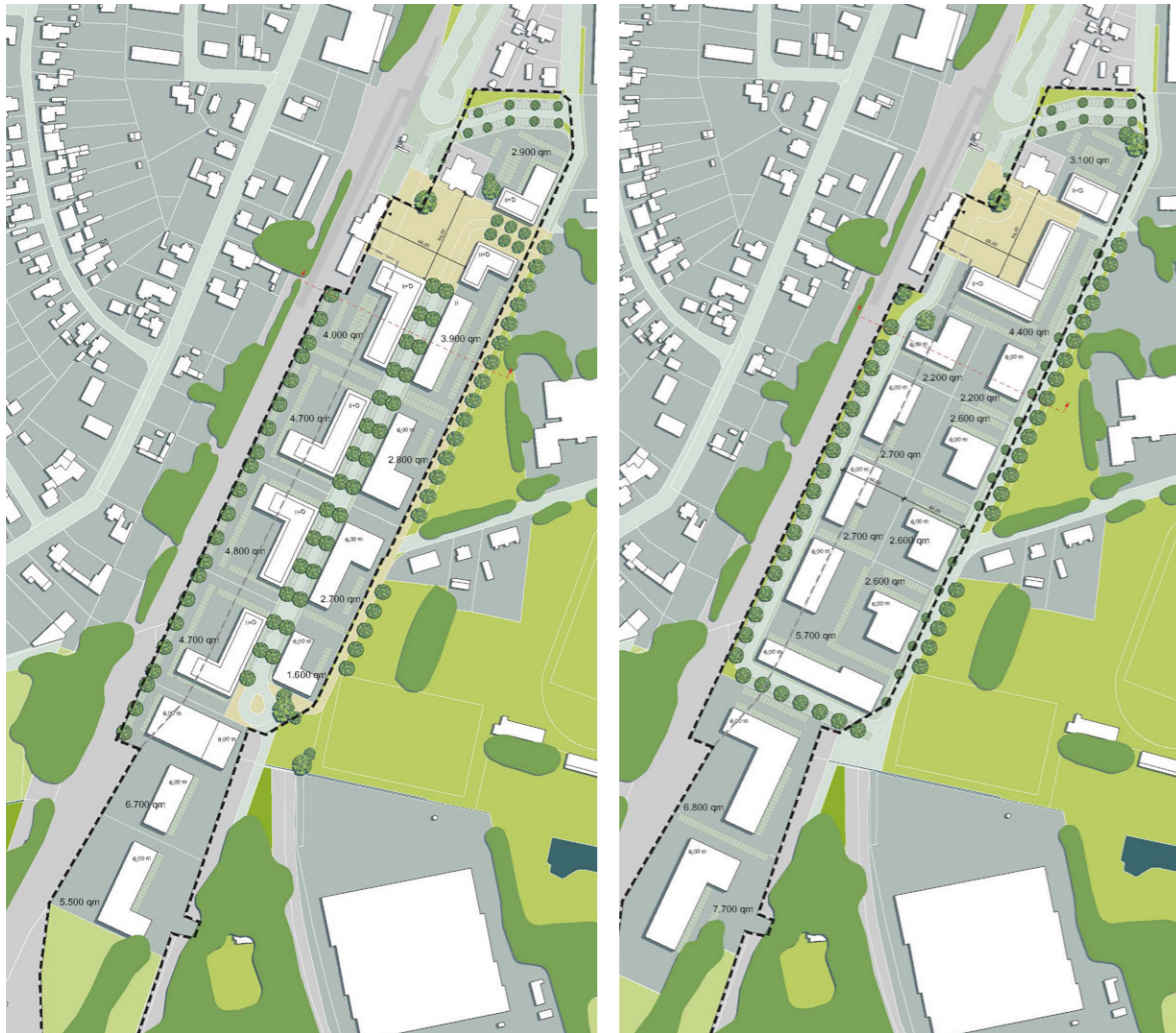
Konzept: Zentrale Achse

Wittingen Mittelzentrum | Niedersachsen Bevölkerung: 11.489 | Stand 2022