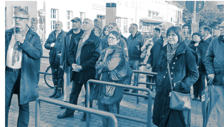
Bürger*innenbeteiligung als Stadtspariergang mit Infotafeln im öffentlichen Raum

Peine Mittelzentrum | Niedersachsen Bevölkerung: 52.285 | Stand 2023