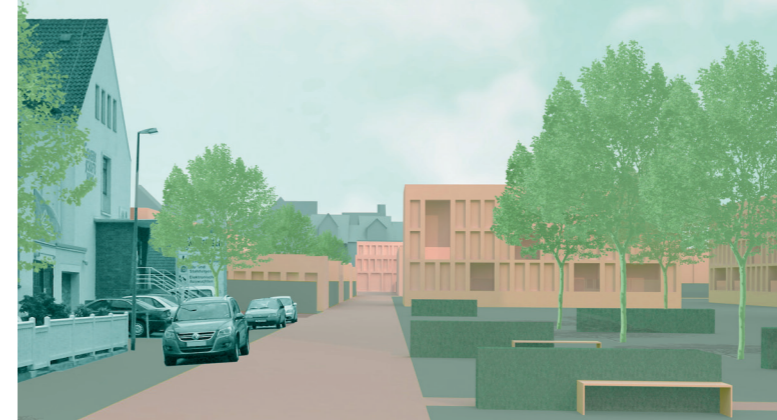
Perspektive 1 – Erschließung über die Lindenstraße