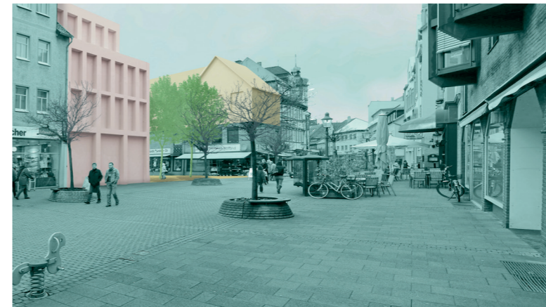
Perspektive 2 – Anbindung an die Haupteinkaufslage