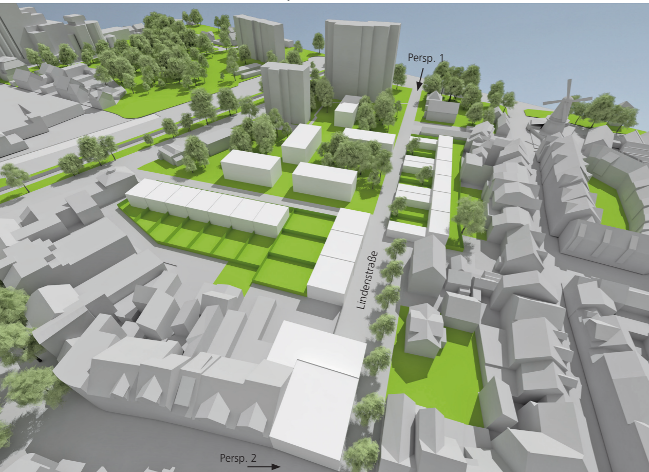
Ehemaliges City Center, Entwicklungsmodell 3 (Neustrukturierung)