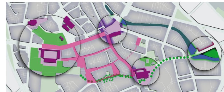
Empfehlung: Attraktives öffentliches Netz zwischen den Polen schaffen