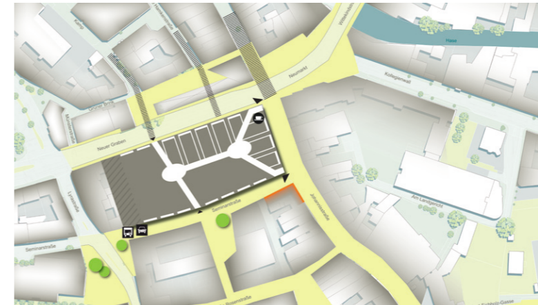
Center Modell – bevorzugte Variante 1A

Osnabrück Oberzentrum | Niedersachsen Bevölkerung: 167.366 | Stand 2022