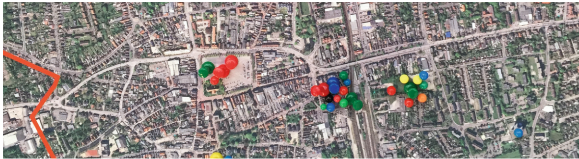
Auftakttermin: Vorschläge für geeignete Standorte

Gutachten zur räumlich-städtebaulichen Positionierung