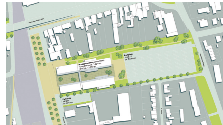
Konzept: Standort Ostseite Bahnhof