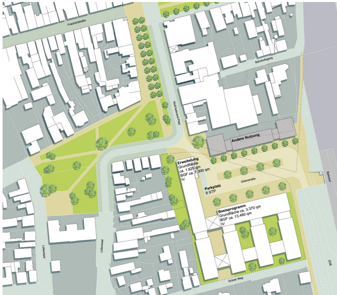
Konzept: Standort Westseite Bahnhof mit Programmerweiterung