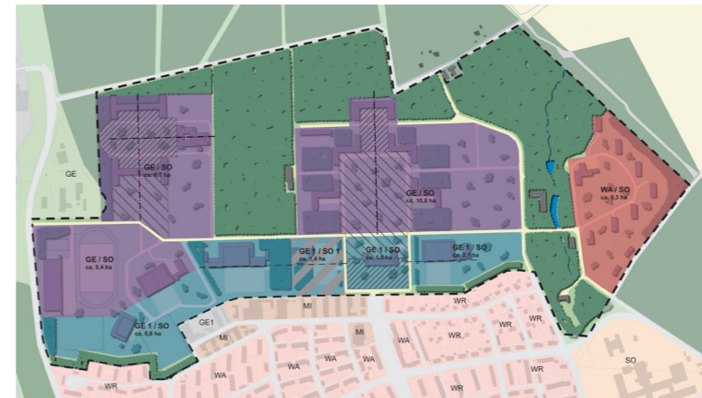
Nutzungsmodell (Variante 1/3)