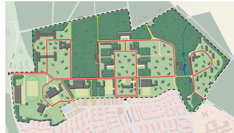
Erschließungsmodell (Variante 2/3)

Goslar Mittelzentrum | Niedersachsen Bevölkerung: 49.714 | Stand 2023