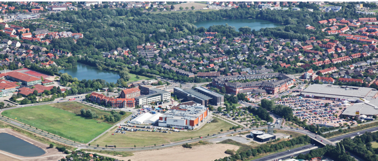
Blick auf die bestehende Mitte in Garbsen