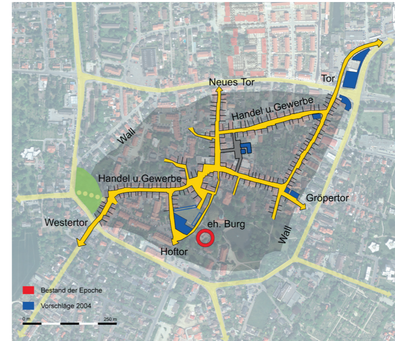
Strukturanalyse – Mittelalterlich geprägte Struktur

Wolfsburg Oberzentrum | Niedersachsen 122.500 Einwohner | Stand 2003