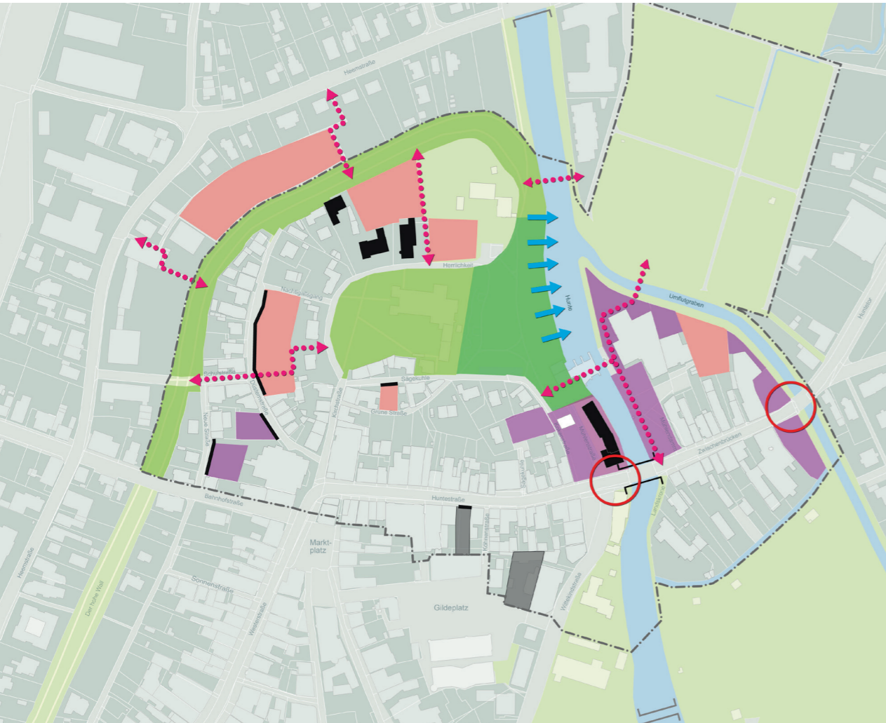
Quartierskonzept Huntetor: Entwicklungspotentiale