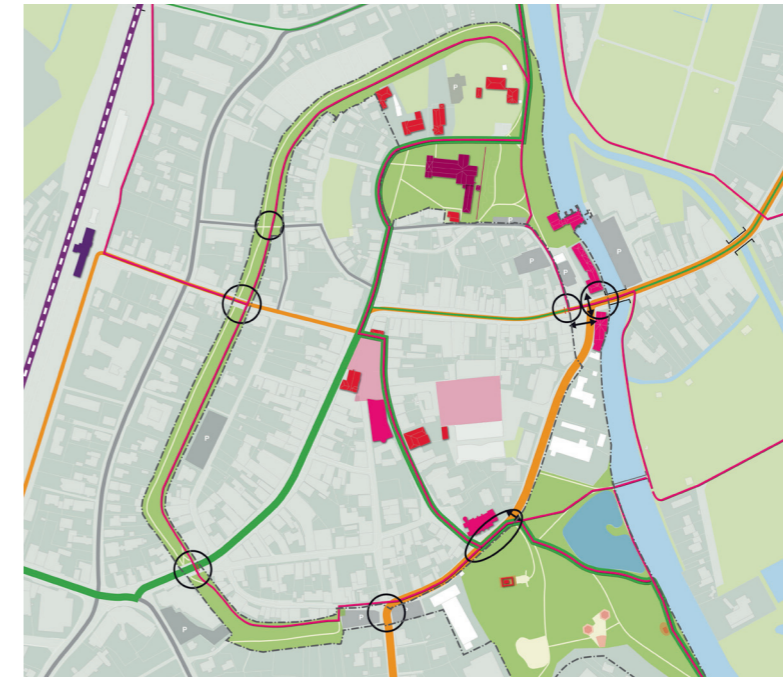
Quartierskonzept Wallanlagen: Vernetzung

Wildeshausen Mittelzentrum | Niedersachsen 19.390 Einwohner | Stand 2017