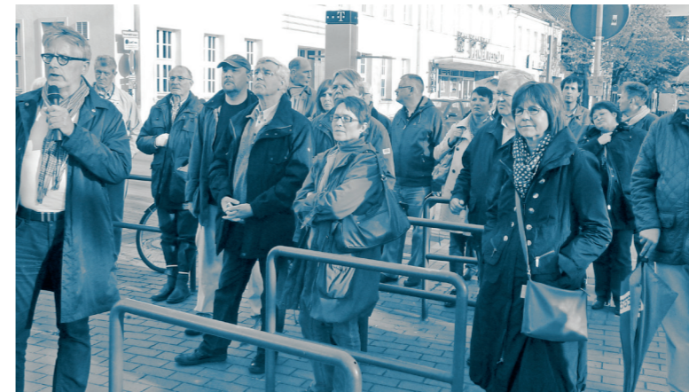
Bürgerbeteiligung als Stadtsparzierung mit Infotafeln im öffentlichen Raum

Peine Mittelzentrum | Niedersachsen 49.000 Einwohner | Stand 2012