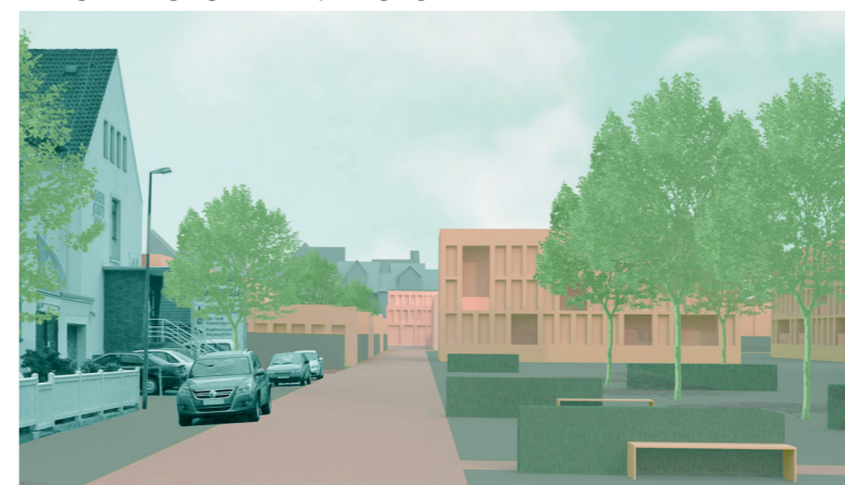
Perspektive 1 – Erschließung über die Lindenstraße