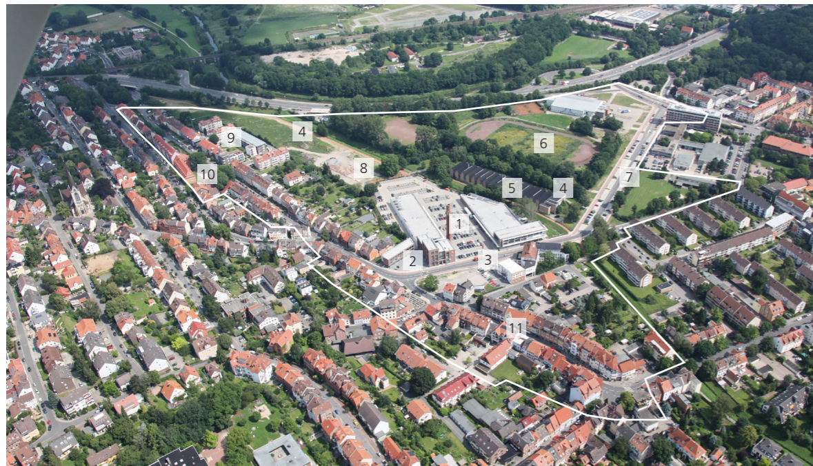
Stadtumbaugebiet Moritzberg mit Phoenixgelände