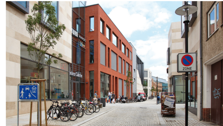
Handelszentrum mit neuem Fokus: Arneken Galerie

Hildesheim Oberzentrum | Niedersachsen Bevölkerung: 103.814 | Stand 2022