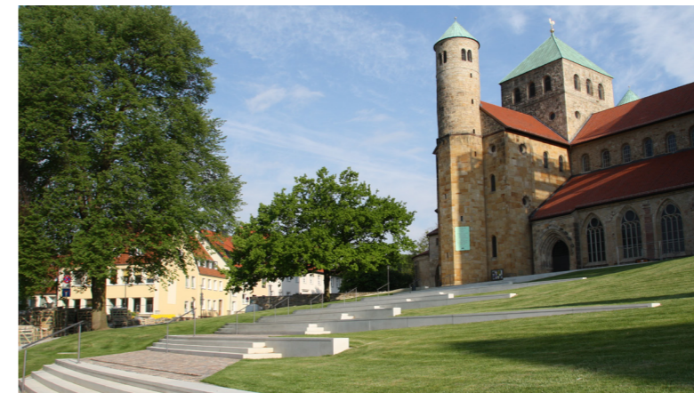
Aufwertung des Umfelds von St. Michaelis