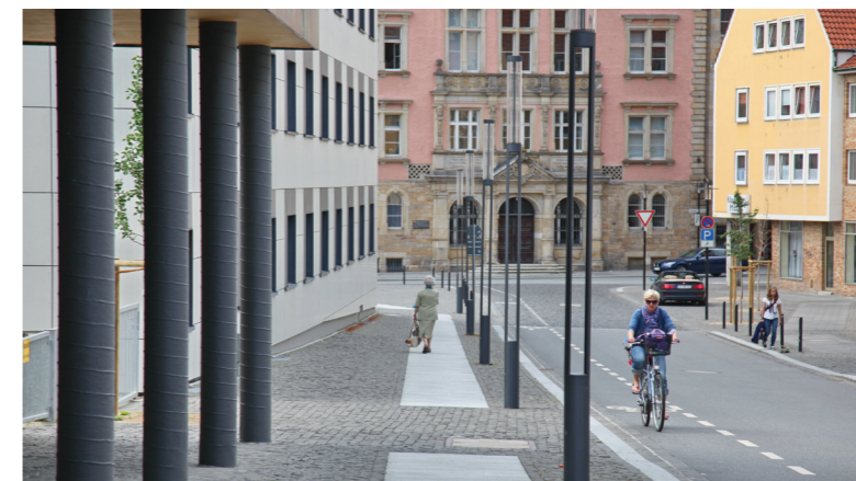
Neu gestaltete Kreuzstraße mit genügend Raum für alle Verkehrsteilnehmenden