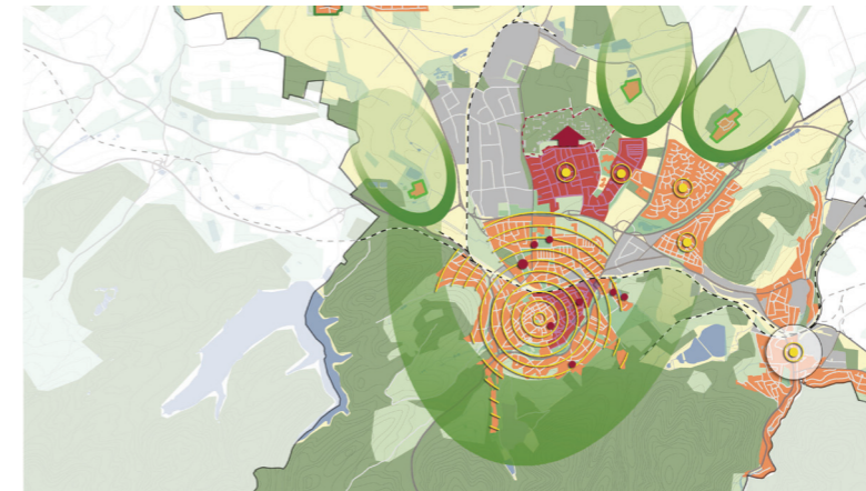
Räumliches Leitbild Siedlungsentwicklung