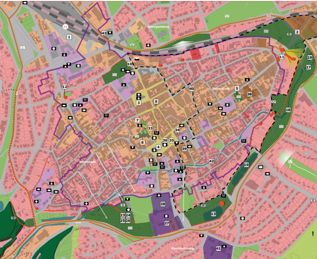
Stadtteilkonzept Altstadt mit Entwicklungsflächen und Maßnahmen