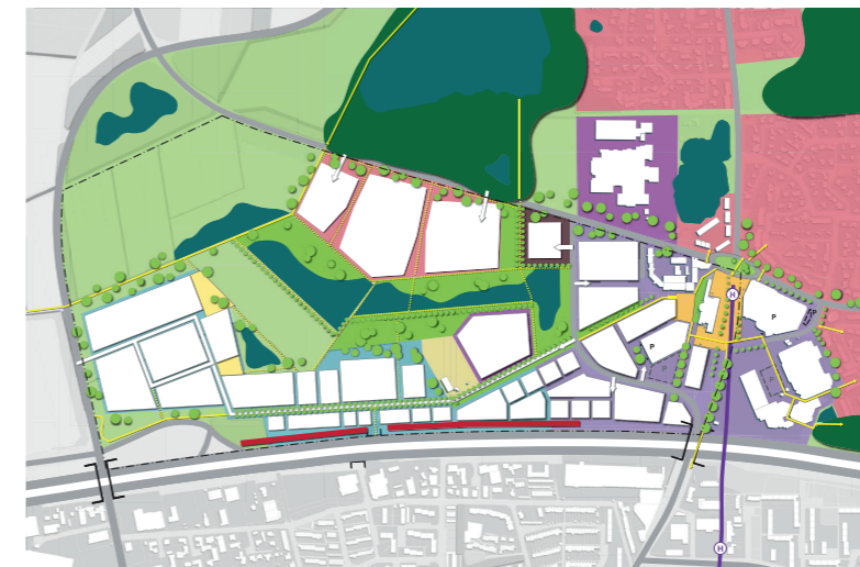
Strukturkonzept, Szenario 1: Starke Entwicklung, Vernetzung Zentrum und Gewerbe

Garbsen Mittelzentrum | Niedersachsen 60.590 Einwohner | Stand 2015