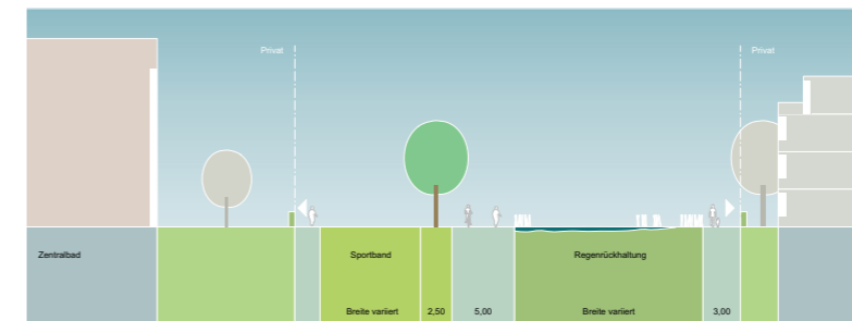
Weg durch den Landschaftspark