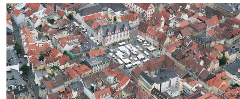
Blick auf den Coburger Marktplatz