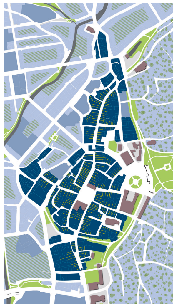
Bau- und Parzellenstruktur