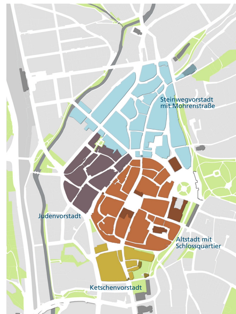
Profilierung von vier Innenstadtquartieren