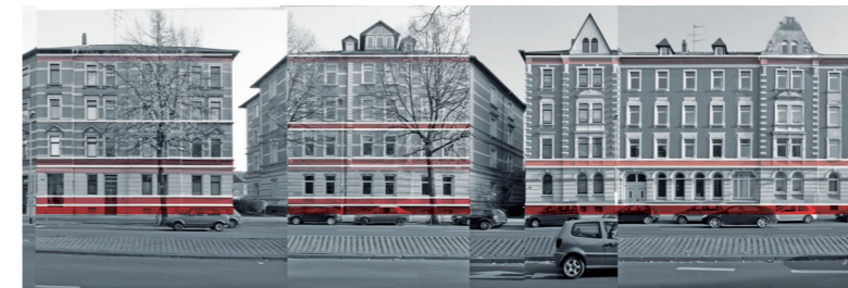
Schema zur horizontalen Fassadengliederung