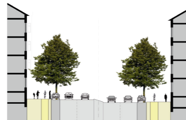
Prägnante Profile ausbilden