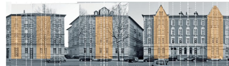
Schema zur vertikalen Fassadengliederung